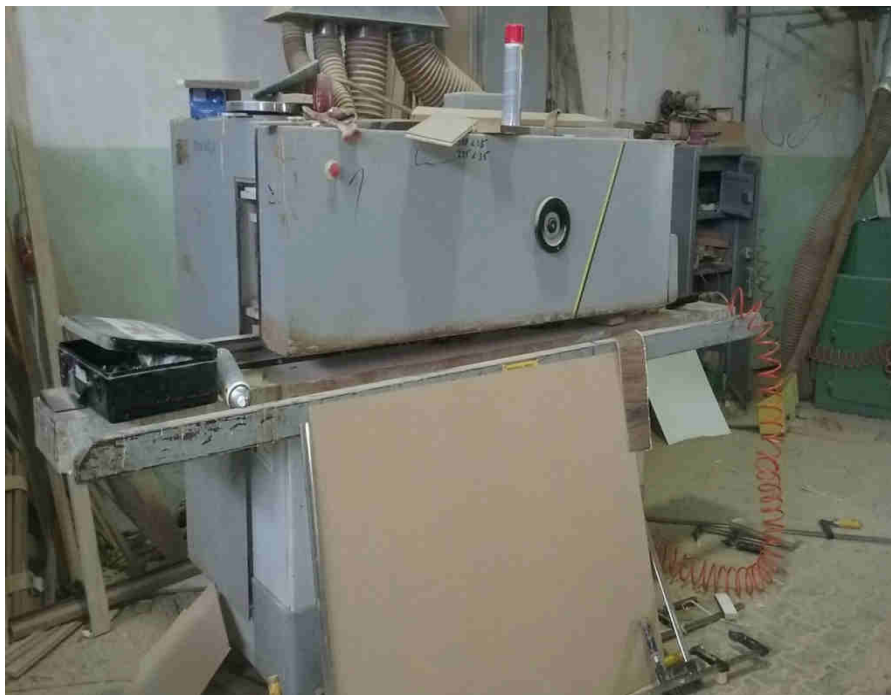
Frezarka profilarka, producent GOMA