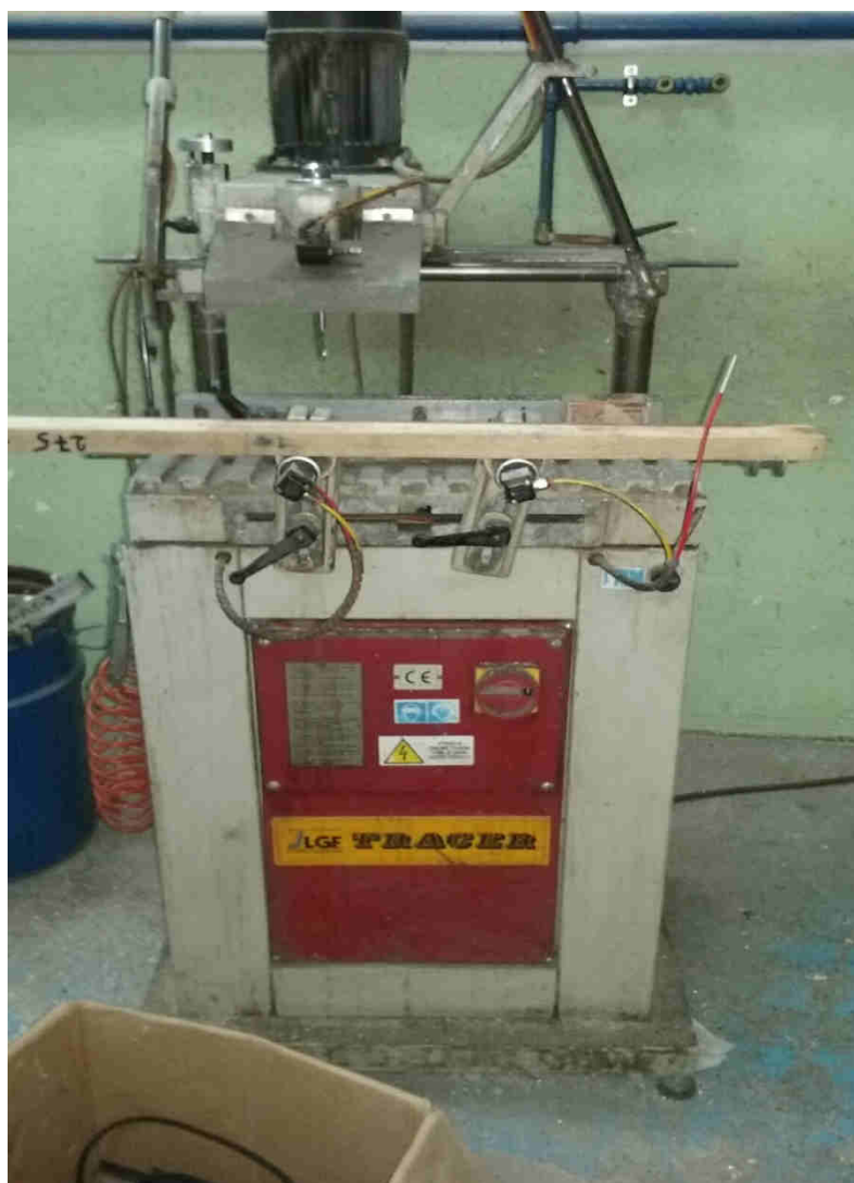
Frezarko kopiarka, producent LGF s.n.c.