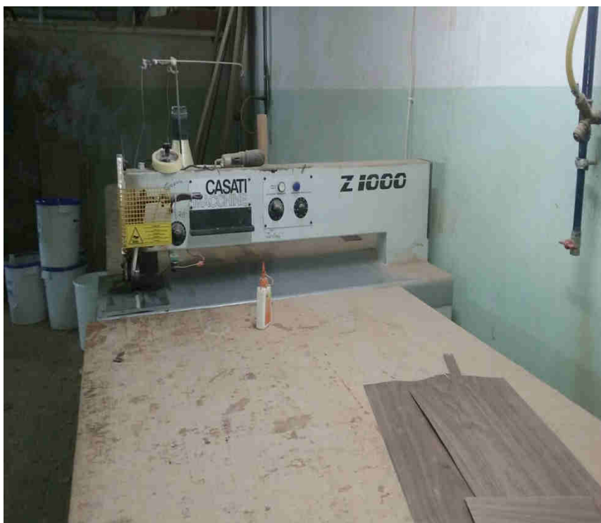
Zszywarka (zgrzewarka) do forniru, producent CASATI MACCHINE S.R.L.